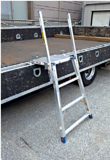
① トラックあおりを下した状態での作業