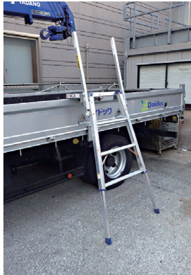
② トラックあおりでの作業